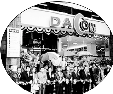
데이콤이 최근 부산 부산진구 부전동에 문을 연 'N-터'.

한편 (주)데이콤은 오는 2003년까지 전국에 모두 50곳의 'N-터'를 확충할 계획이다. 0605-501-1002